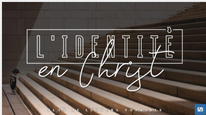
L'identité en Christ

Autres plans de lecture qui pourraient vous intéresser