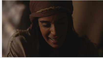
Évangile selon Matthieu en vidéo en 88 jours