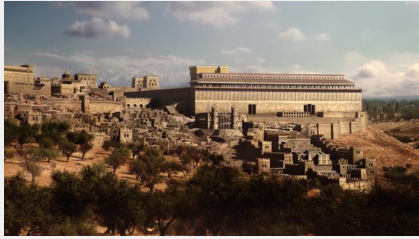
Évangile selon Luc en vidéo en 105 jours