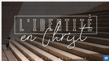
L'identité en Christ

Autres plans de lecture qui pourraient vous intéresser