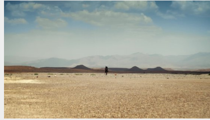
Évangile selon Marc en vidéo en 63 jours